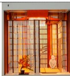
昨年の最優秀作品

インテリアデザインコンペは日本人の住まい方の感性と視点を活かした“デザイン×ファッション=近未来インテリア”を発信するイベントとして定着しています。今回のテーマは JAPANTEX2011 のテーマに連動させて「Good day, Good style」～インテリアでできること～で募集。入選作品(最優秀賞、優秀賞など)は JAPANTEX 会場内に展示。11月9日(水)には表彰式があります。