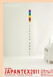
JAPANTEX 2011 ポスター