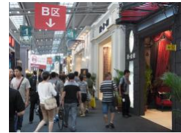
ShenzhenHometex2012 インテリアビジネスニュース 提供