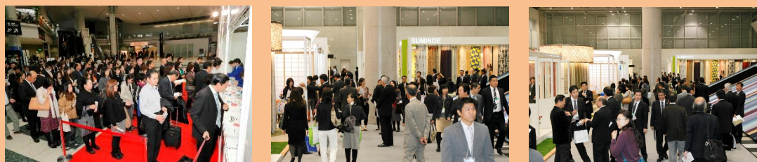
昨年賑わった JAPANTEX2011 の会場。今年もご期待ください。

今後も JAPANTEX2012 について、継続的に情報発信をしてまいります。 JAPANTEX2012 の情報は http://www.japantex.jp でもご覧いただけます。